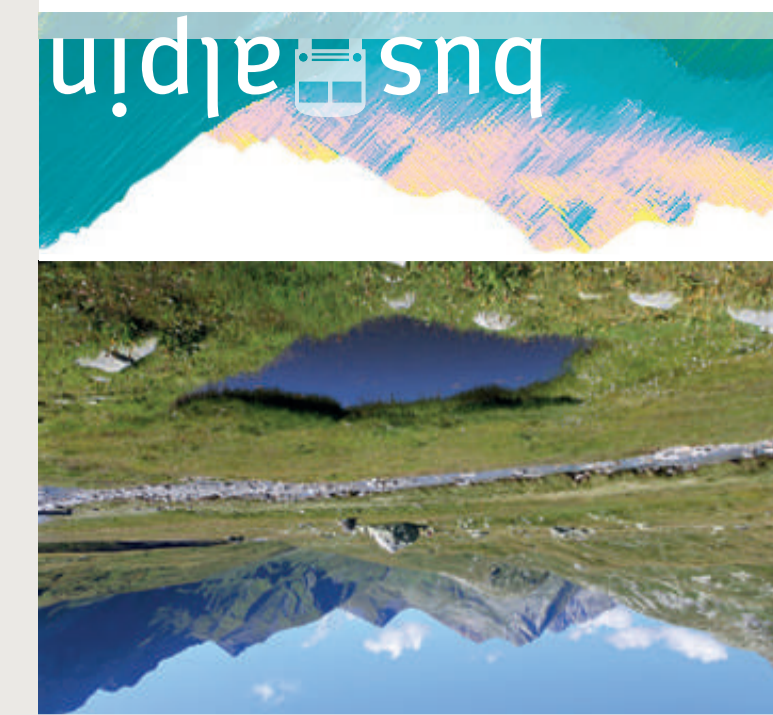
Valle di Blienio – Sumvitg – Valle di Lumnezia